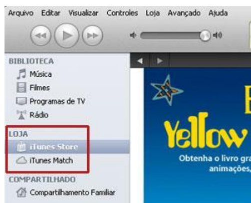
Ícone da iTunes Store aparece na barra da esquerda do aplicativo

Para acessar a loja do iTunes, é preciso baixar o aplicativo no site da Apple. O download é gratuito. Após abrir o programa no computador, a iTunes Store estará logo abaixo do item "Loja", na barra à esquerda. O usuário deve apenas clicar em cima para entrar no serviço. A última versão do iTunes para Mac e Windows inclui a iTunes Store. Para comprar músicas e filmes, é necessário ter um cartão de crédito válido, com endereço de cobrança no Brasil.