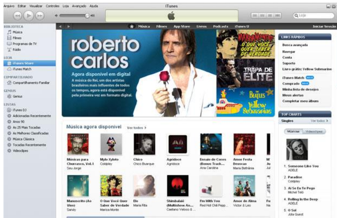
Serviço no Brasil conta com artistas brasileiros como Roberto Carlos e Marisa Monte

A Apple anunciou nesta terça-feira (13) o lançamento da iTunes Store no Brasil. O serviço no país conta com músicas brasileiras e internacionais de gravadoras e selos independentes.